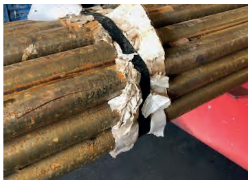
Рис. 1. Внешний вид проката при попадании атмосферной влаги на поверхность

Молекулы контактного летучего ингибитора коррозии (КЛИК) формируют на поверхности металла невидимую молекулярную пленку толщиной от 3 до 5 молекул. Этот слой молекул пассивирует поверхность металла и создает барьер, который предотвращает окисление. При этом для обеспечения защиты не требуется герметичность упаковки. Достаточно иметь плотную упаковку, гарантирующую защиту от свободного проникновения воздуха и прямого попадания влаги. Упаковка позволяет хранить и транспортировать металлические изделия длительное время без каких-либо дополнительных затрат на консервацию. Когда упаковка открывается и металлические изделия извлекаются из нее, защитный слой исчезает в течение нескольких часов. При этом изделия из металла будут чистыми, сухими и не будут иметь следов коррозии, т. е. будут готовы к немедленному использованию. Для работы с изделиями не требуется никаких дополнительных операций по мойке, удалению коррозии механическим или химическим способом. В силу того что молекулы КЛИК обладают летучестью, они проникают в труднодоступные места металлических изделий сложной формы. Молекулы адсорбируются на поверхности металла до тех пор, пока не будет сформирован необходимый защитный слой. Химические компоненты КЛИК обладают хорошей летучестью и способностью создавать крепкие адсорбционно-химические связи, что