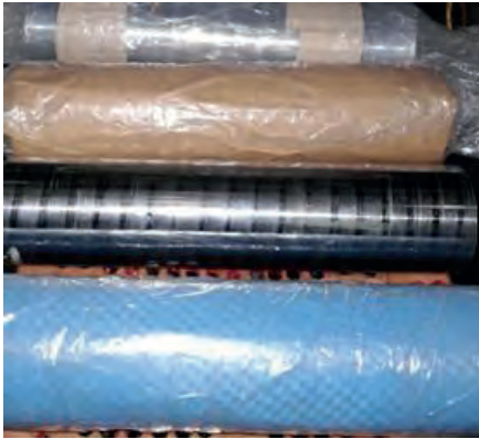
Рис. 4. Образцы проката с опытными покрытиями

позволяет при упаковке металла создавать в контактной форме на поверхности металла защитный молекулярный слой, который служит барьером, предохраняющим поверхность металла от воздействия влажности, ионов соли, кислорода и других коррозионных поражений металла, происходящих за счет воздействия на поверхность металла этих вредных факторов. Защитный слой в контактной форме постоянно «подкачивается» новыми ингибиторами, непрерывно испаряющимися из носителя. Благодаря непрерывной «подкачке» существует возможность многократно открывать упаковку для извлечения отдельных изделий и вновь закрывать ее без нарушения защиты оставшихся внутри металлоизделий*.