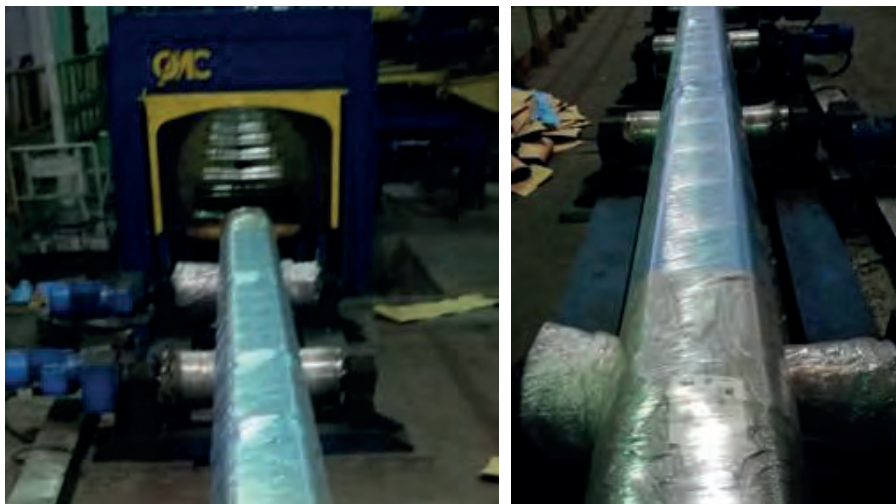
Рис. 5. Упаковка проката опытным материалом с летучим ингибитором коррозии

от коррозии. Применение полипропиленовой ткани в составе упаковочного материала обеспечивает высокую прочность, устойчивость к проколам и целостность упаковки во время проведения погрузочно-разгрузочных работ.