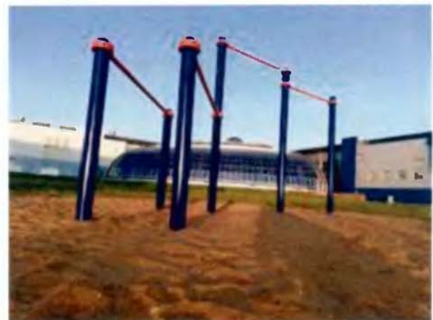
Рис. 1. Двухуровневый турник с брусьями (1-й этап проекта, лето 2019 г.)

Для реализации первого проекта из составленного перечня оптимальным местом для современной спортивной площадки была выбрана территория действующего Центра олимпийского резерва как оптимальное расположение и место притяжения любителей здорового образа жизни. В