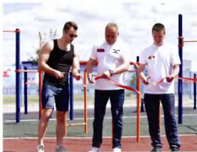
Рис. 3. Момент разрезания красной ленты на торжественном открытии воркаут-площадки на территории Центра олимпийского резерва г. Жлобина

В результате в рамках празднования 35-летнего юбилея Белорусский металлургический завод предложил своим деловым и стратегическим партнерам воздержаться от традиционного предоставления сувенирных и протокольных подарков, которые традиционно пополняют экспозицию заводского музея, а по возможности принять участие в финансировании социально значимого спортивного объекта для города (рис. 2).